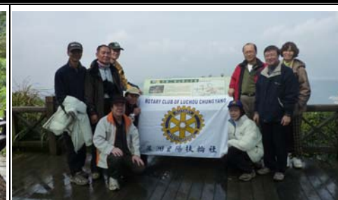
筆架山頭留下腳印