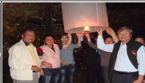
放天燈 祈求-風調雨順 國泰民安 社運昌隆