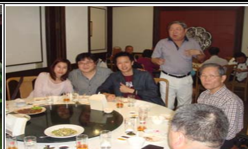
泰國料理餐廳聚餐