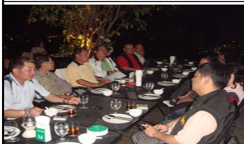
於飯店屋頂欣賞夜景用餐