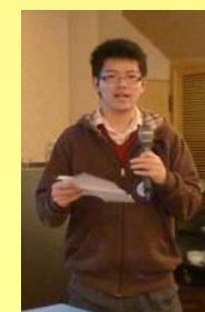
參與例會合影 演說