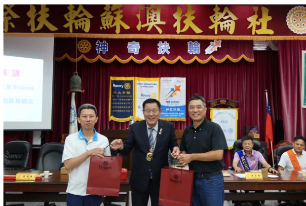
七月份出席獎得獎者：PP. EN 及 Water