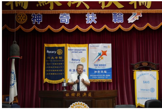
8/21(三)邀請李守正博士蒞臨專題演講