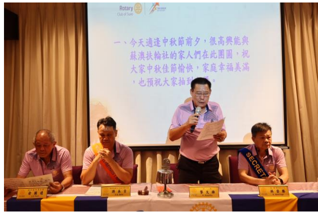
9/11(三)舉辦本社中秋聯歡晚會