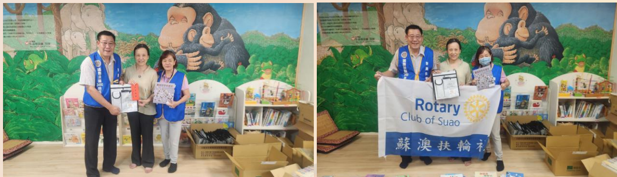
參與五工友好社移動式例會暨中秋聯歡晚會