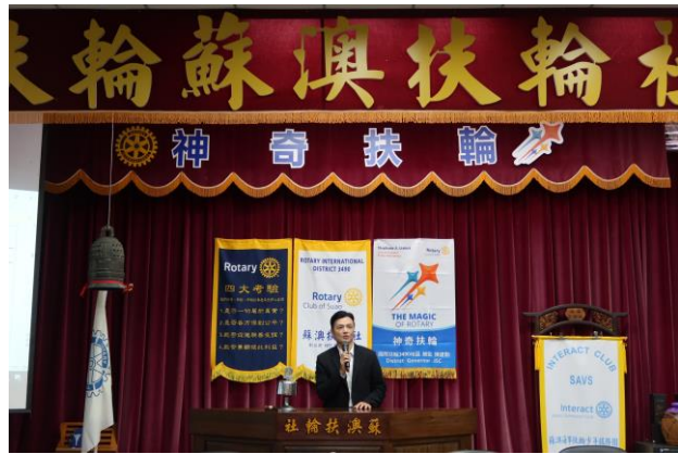
10/16(三)邀請宜蘭縣政府刑事警察大隊 鄭偉豪大隊長蒞臨專題演講