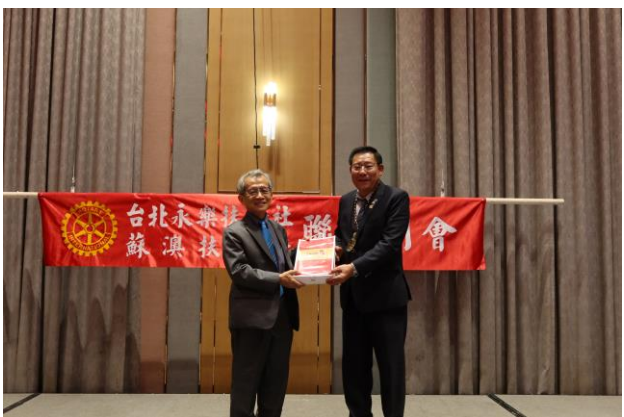
感謝金蘭社贈送伴手禮