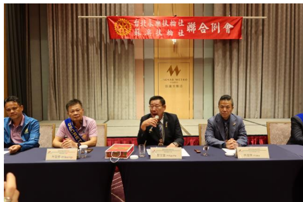
10/26(六)本社與永樂扶輪社聯合例會 Piao Pie 社長致閉會詞