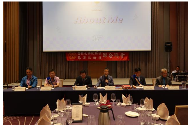
10/26(六)本社與永樂扶輪社聯合例會 主辦社- Idea 社長致開會詞