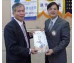
▲致贈本社社旗及講師車馬費