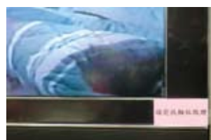
▲致贈液晶電視乙台