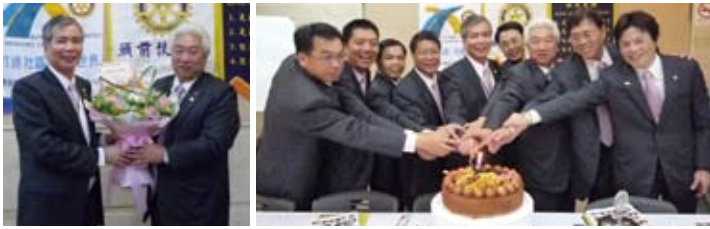
▲恭喜CP Net結婚 ▲恭喜12月生日的社友及夫人們週年快樂唷!!