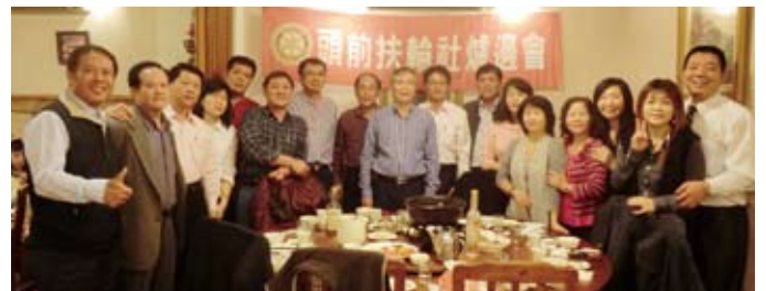
▲第二組爐邊會~King主辦