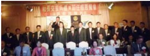
▲新任社長Black介紹新年度團隊