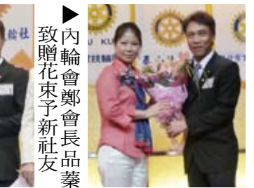
▲內輪會鄭會長品琴致贈花束予新社友