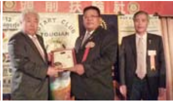
▲交接儀式-由CP Net頒贈新任社長Black當選證書