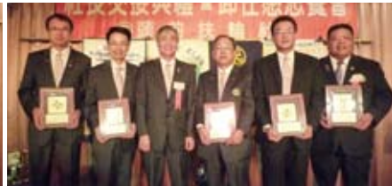
▲年度熱心社務榮譽榜