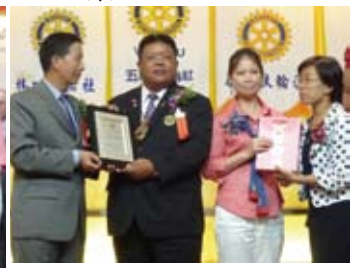
▲助理總監伉儷致贈紀念品予社長伉儷