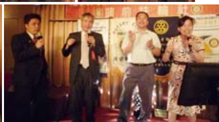
▲2010-11年度第六分區各社社長獻唱