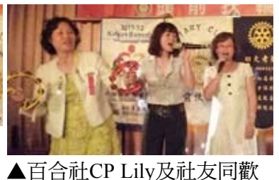
▲百合社CP Lily及社友同歡