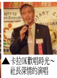
▲卡拉OK歡唱時光~社長深情的演唱