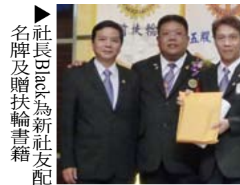
▲社長Black為新社友配名牌及贈扶輪書籍