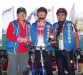
▲恭喜獲得腳踏車乙台