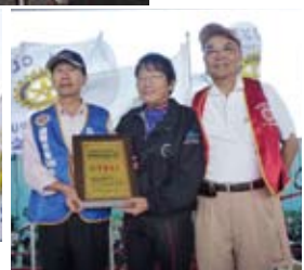
▲贈感謝狀予功學社講師