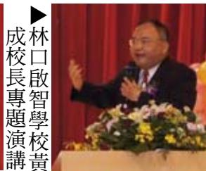
▶成校長專題演講 林口啟智學校黃開