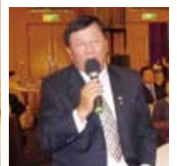
▲Q&A~母社社友 安東尼提問