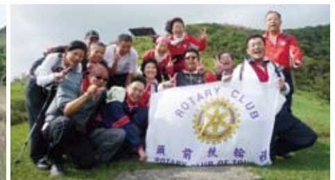
▲跟上社長腳步...大家開心不已