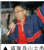
▲感謝登山主委 CPA的精心策劃