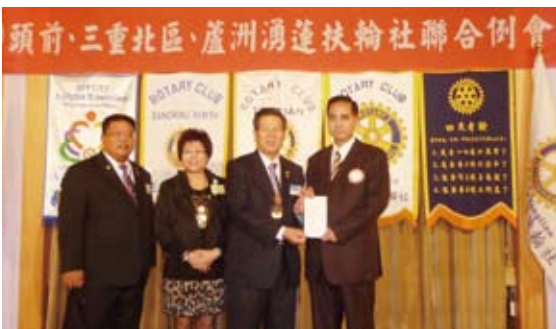
▲由三重北區社社長 Color致贈講師費