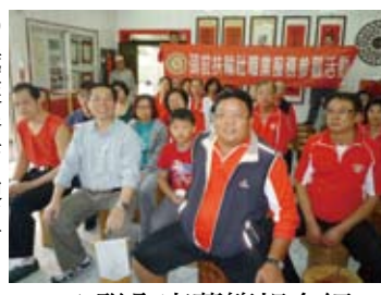
▲聯全麻薯簡報介紹