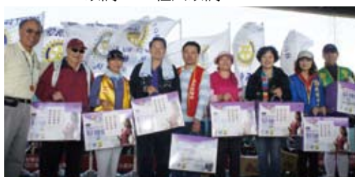
▲各社得獎者獲地區副秘書禮品一份