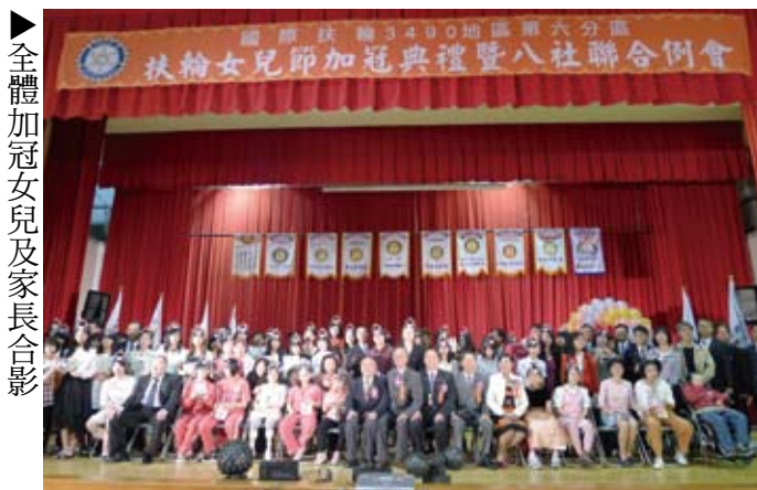
▶全體加冠女兒及家長合影