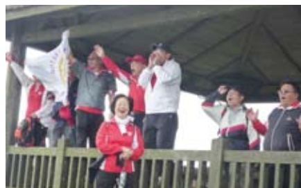
▲有沒有聽到我們的呼喊聲...Y