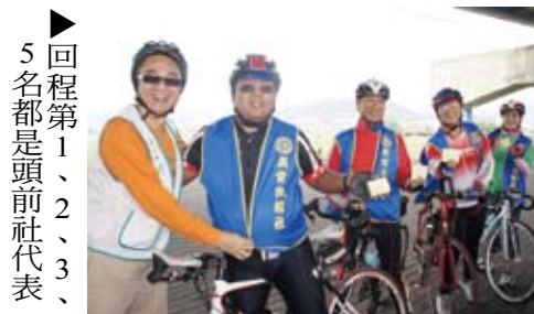
▶ 回程第1、2、3、5名都是頭前社代表