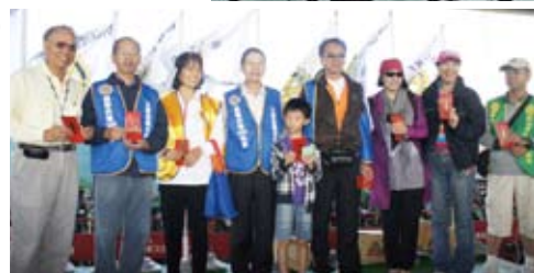
▲各社得獎者獲助理總監紅包一個