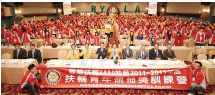
▲宜蘭—香格里拉飯店~冬山河