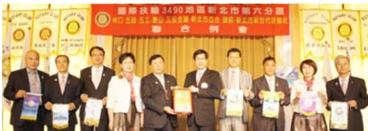
▲致贈講師紀念品及各社社旗