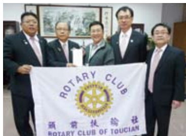
▲頒贈獎助學金-昌平國小