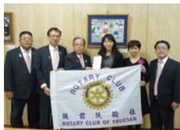
▲致贈中信國小獎助學金