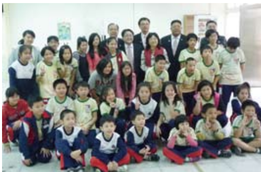
▲與頭前國小學生合影