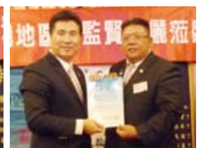
▲恭喜IPBlack榮任地區鼓勵出席委員會委員