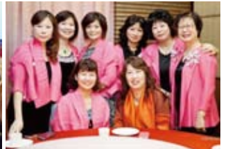
▲DG夫人與頭前內輪會