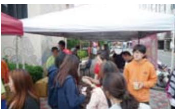
▲捐血的民眾相當踴躍喔~