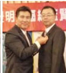
▲總監為新社友配章