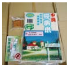
▲本社準備的捐血紀念品