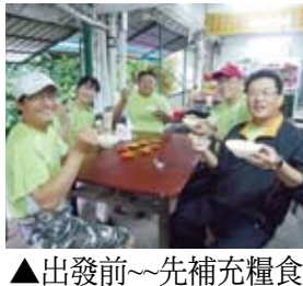
▲出發前~先補充糧食