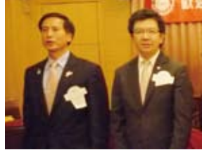
▲歡迎地區秘書Camera及地區副秘書Car