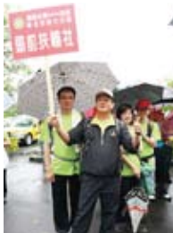
▶ 助理總監與本社合影