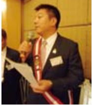
▲臨危授命擔任聯誼~King