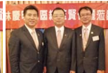
▲總監與新社友、社長合影