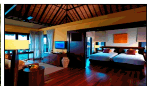
CANARY PLAM VILLA

2010 年 5 月開幕的黃金棕櫚海上渡假村為馬來西亞最新旅遊地標、酒店。位於馬來西亞西南部海岸線，正對麻六甲海峽的隱蔽水域，遠離塵囂，無敵海景，盡收眼底。房間數共建有 393 間海上渡假屋，均為雙拼渡假村或聯排渡假村設計，與周圍自然生態環境渾然一體，有著異國情調的熱帶天堂，設計結構受了玻利維亞和馬爾地夫元素的影響採用了天然的混合材料，將巴里島熱帶氣息的理念融入風景如畫的設計裡。