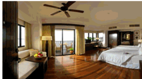
TRAVELERS PALM VILLA