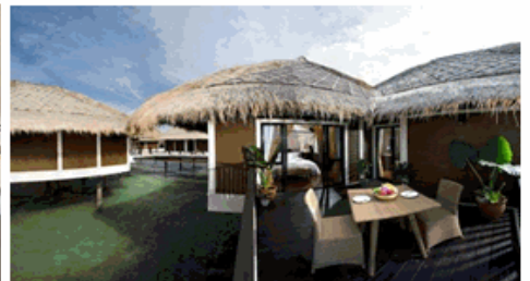
渡假屋均有私人陽台