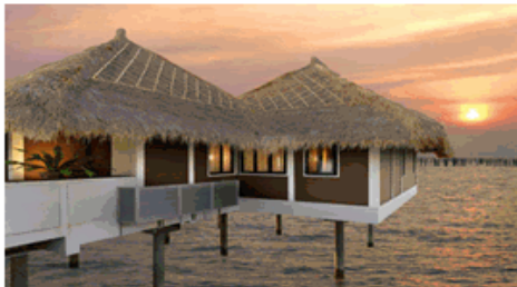
黃金棕櫚樹海上渡假村