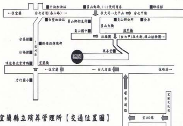
宜蘭縣立殯葬管理所【交通位置圖】

【福園衛星定位 +24° 45'20.69", +121° 41'57.74'】 http://m.google.com.tw/u/m/Au80kk