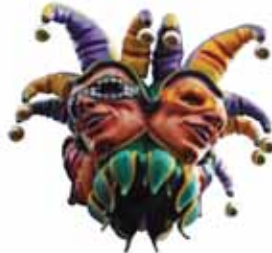
狂歡節的歡樂氣氛