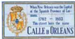
蔚為傳奇的法國區