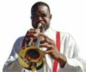
不負爵士樂誕生地盛名的現場音樂演奏