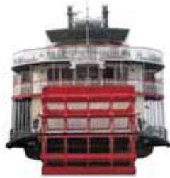
搭乘蒸汽船遊覽偉大的密西西比河