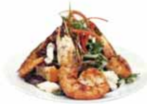
由世界級大廚烹調的卡真(Cajun)和克里奧(Creole)菜餚